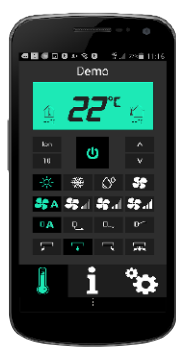
Appstyrning via Wi-Fi ingår. Finns till både Iphone och Android.