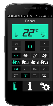
Appstyrning via Wi-Fi finns som tillbehör.